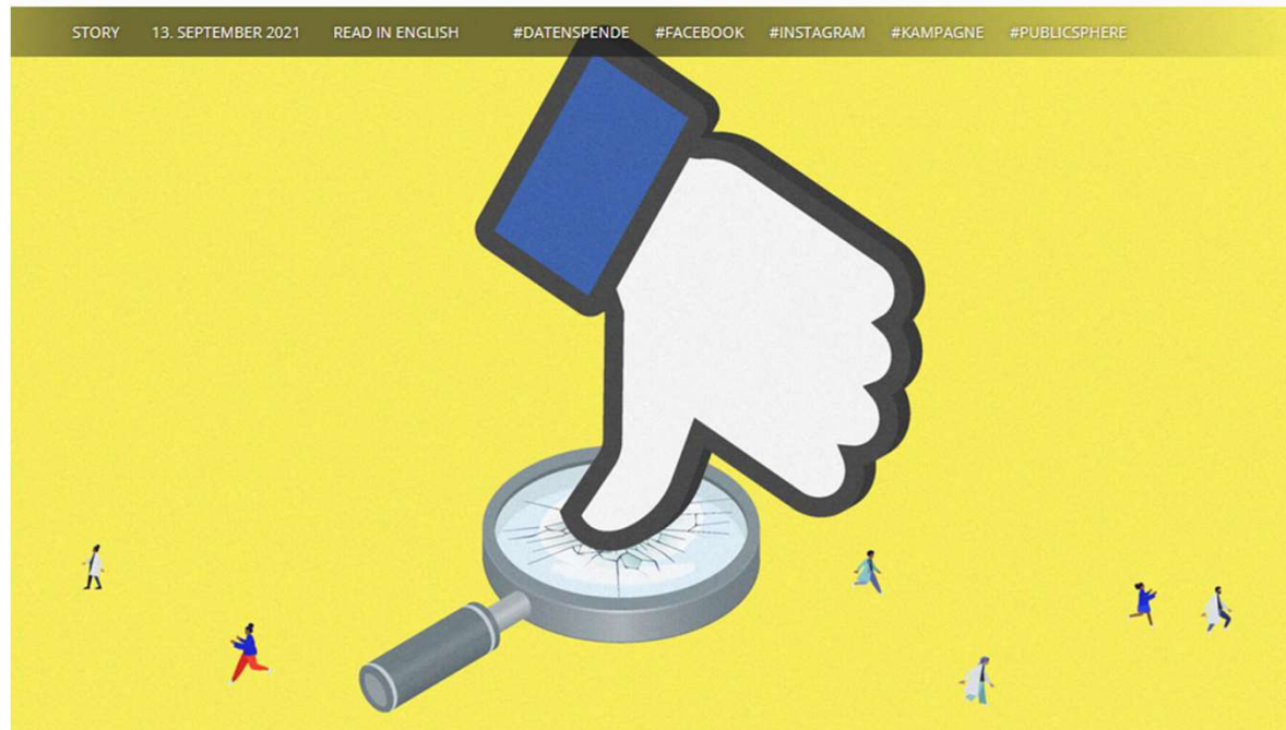
Illustration by Pablo Staninec, COO / Adobe Stock

STORY 13. SEPTEMBER 2021 READ IN ENGLISH #DATENSPENDE #FACEBOOK #INSTAGRAM #KAMPAGNE #PUBLICSPHERE